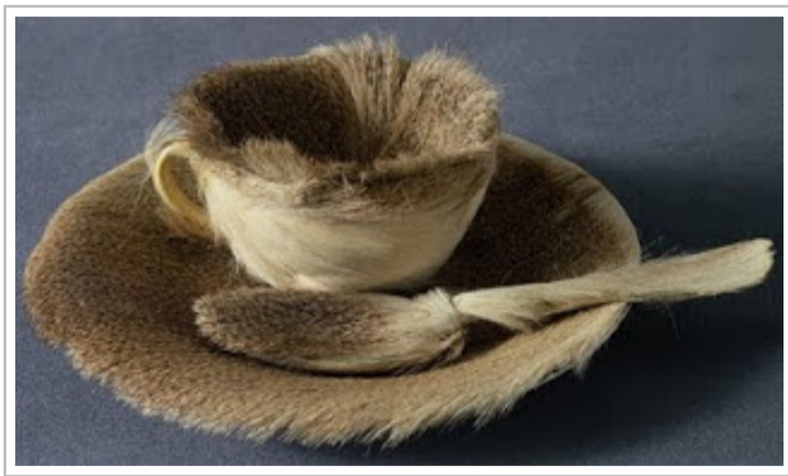
Φλιτζάνι τοῦ τσαγιοῦ ἐπενδυμένο μετὰ μινκ (1936), Μέρετ Ὀππενχάιμ.

Βέβαια, στη δεύτερη περίπτωση έχουμε να κάνουμε με την παραμορφωτική επέμβαση ενός καλλιτέχνη, όποτε εισδύουμε σε άλλα χωράφια, τὰ χωράφια τῆς τέχνης ἢ, ὀρθότερα, τῆς καλλιτεχνικῆς ἔκφρασης. Καὶ δὲν μιλάμε φυσικὰ γιὰ τὴν ὑψηλὴ Τέχνη, ἢ ὁποῖα ἀνέκαθεν συνδέεται μετὰ τὴν ἔννοια τοῦ ἱεροῦ, ἀφοῦ ἡ τέχνη εἶναι ἐξ ὀρισμοῦ ἱερή, ἢ δὲν εἶναι τέχνη, ἔστω κι ἂν παράγεται ἀπὸ καλλιτέχνη. Κανείς ὅμως δὲν μπορεῖ νὰ μὲ πείσει ὅτι δὲν εἶναι ἀποκρουστικὸ τὸ ἐπενδυμένο μετὰ γούνα μινκ φλιτζάνι τοῦ τσαγιοῦ (1936) τῆς Μέρετ Ὀππενχάιμ (Meret Oppenheim, 1913-1985) ἢ ὅτι δὲν