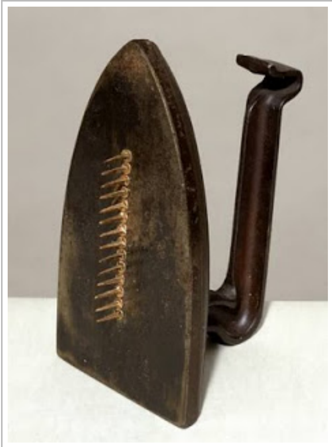
Σίδερο σιδερώματος με καρφιά (1921), Μάν Ρέν.

Βέβαια, στη δεύτερη περίπτωση έχουμε να κάνουμε με την παραμορφωτική επέμβαση ενός καλλιτέχνη, όποτε εισδύουμε σε άλλα χωράφια, τὰ χωράφια τῆς τέχνης ἢ, ὀρθότερα, τῆς καλλιτεχνικῆς ἔκφρασης. Καὶ δὲν μιλάμε φυσικὰ γιὰ τὴν ὑψηλὴ Τέχνη, ἢ ὁποῖα ἀνέκαθεν συνδέεται μετὰ τὴν ἔννοια τοῦ ἱεροῦ, ἀφοῦ ἡ τέχνη εἶναι ἐξ ὀρισμοῦ ἱερή, ἢ δὲν εἶναι τέχνη, ἔστω κι ἂν παράγεται ἀπὸ καλλιτέχνη. Κανείς ὅμως δὲν μπορεῖ νὰ μὲ πείσει ὅτι δὲν εἶναι ἀποκρουστικὸ τὸ ἐπενδυμένο μετὰ γούνα μινκ φλιτζάνι τοῦ τσαγιοῦ (1936) τῆς Μέρετ Ὀππενχάιμ (Meret Oppenheim, 1913-1985) ἢ ὅτι δὲν