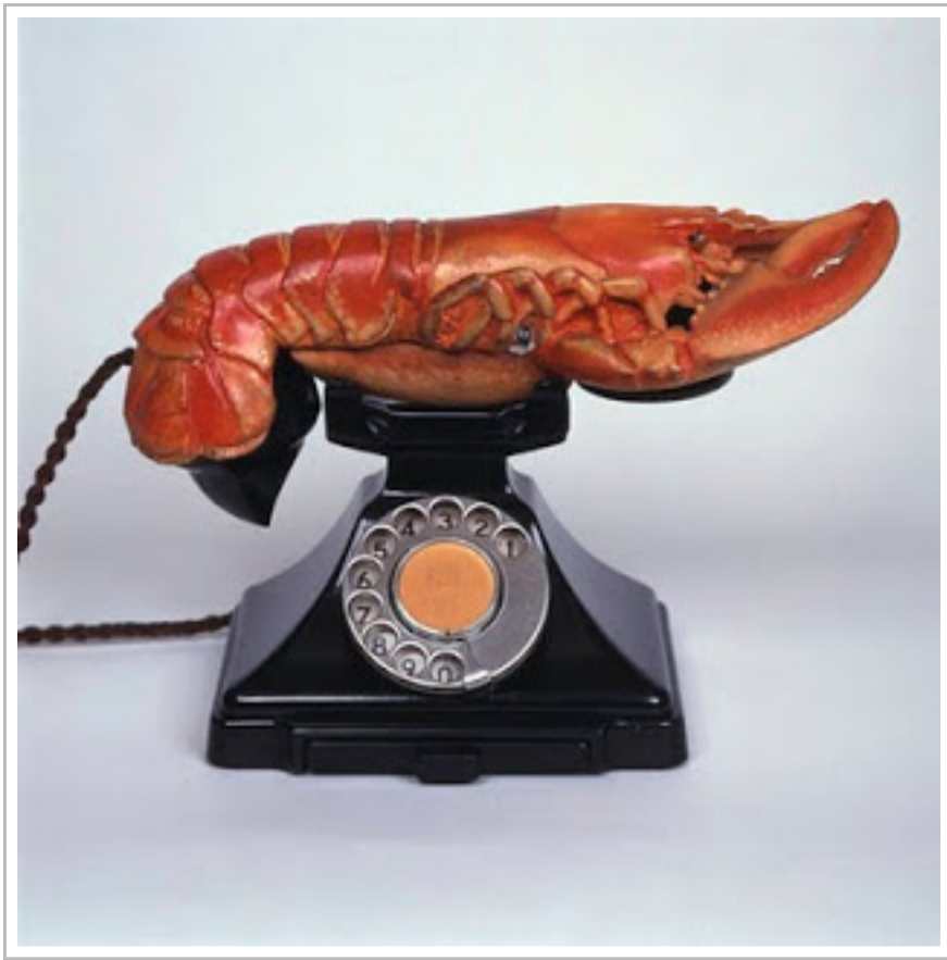
Τηλέφωνο με αστακό για ακουστικό, Σαλβαδόρ Νταλί.

Οί μορφές πού ἀφοροῦν τὸ χῶρο τῆς μυθολογίας (π.χ. οἱ κένταυροι, ἡ Χίμαιρα, ἡ γοργόνα κ.λπ.) δείχνουν νὰ εἶναι πιὸ ἐλεύθερες, ὑπὸ τὴν ἔννοια ὅτι δὲν φαίνεται νὰ ὑπακούουν, ὅπως οἱ φυσικὲς μορφές, στὸν καταναγκασμὸ τῶν Νόμων, παρὰ μόνο στὴ φαντασία καὶ στὴν εὐρηματικότητα τοῦ ἀνθρώπινου νοῦ.